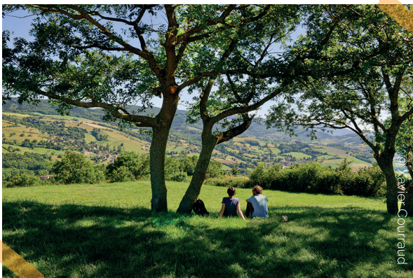
Panorama depuis la Chapelle de Fouillet

Prenez à droite sur la rue Buissonnière et descendez jusqu'au parking de la Salle Amandier, le point de départ de la balade.