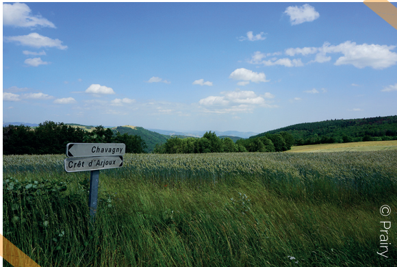
Paysage près du Mont Arjoux

Au cédez le passage, prenez à gauche pour retourner au parking.