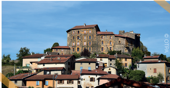
Château de Montbloy

Redescendez pour rejoindre le parking du Fiatet.