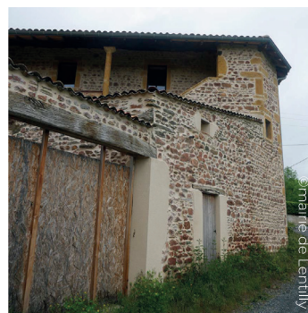
Mairie de Lentilly

Durant cette balade, vous découvrirez des éléments d'un riche patrimoine local, comme le château de Lentilly du 13 ème siècle, des demeures rurales du 18 ème siècle, des croix de chemin datant du 16 ème et 18 ème siècle, un puits du 18 ème siècle ou encore un chêne centenaire.