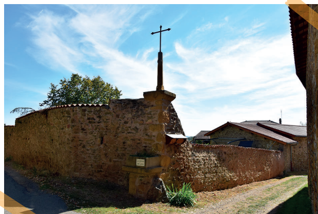
hameau de Lévy

Aux portes de Lyon, Fleurieux-sur-L'Arbresle est un condensé de ce que l'agriculture peut offrir dans sa plus grande diversité. Des activités qui façonnent les paysages que vous aurez plaisir à découvrir tout au long du circuit.