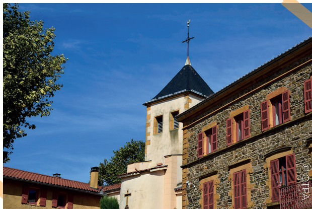
Centre bourg de Fleurieux sur L'Arbresle

Plus loin au niveau de l'arrêt de bus, prenez à droite la rue Jean Lorme qui monte, puis la montée du Chêne où vous pouvez admirer le Château de Fleurieux devenu école publique, ainsi que les deux pavillons récemment rénovés. Vous arrivez à votre point de départ : l'église de Fleurieux, puis l'espace François Baraduc.