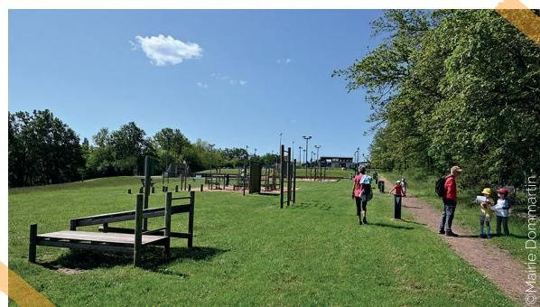
Aire de jeux de Maligny