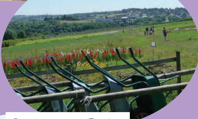
Paysage autour de Fleurieux