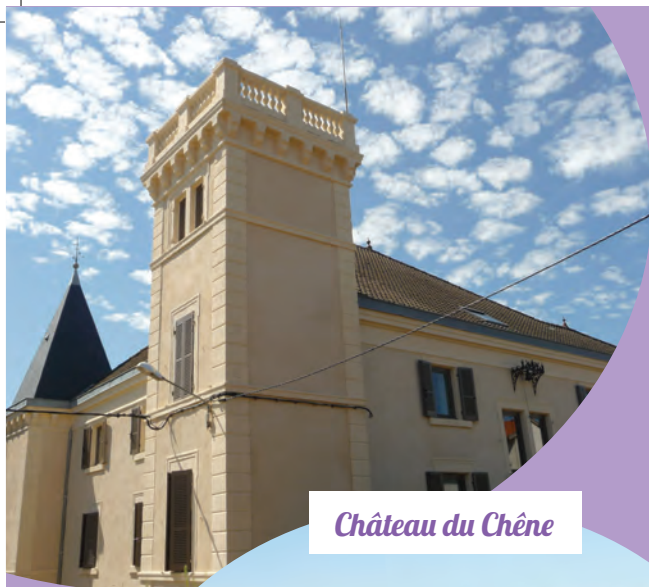
Château du Chêne